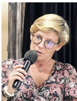
par Gaëlle LEMELTIER